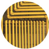
Erdwärme für Fussbodenheizung und Deckenkühlung