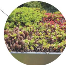
Begrünte Carport Dächer