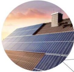
Photovoltaikanlage auf den Dächern