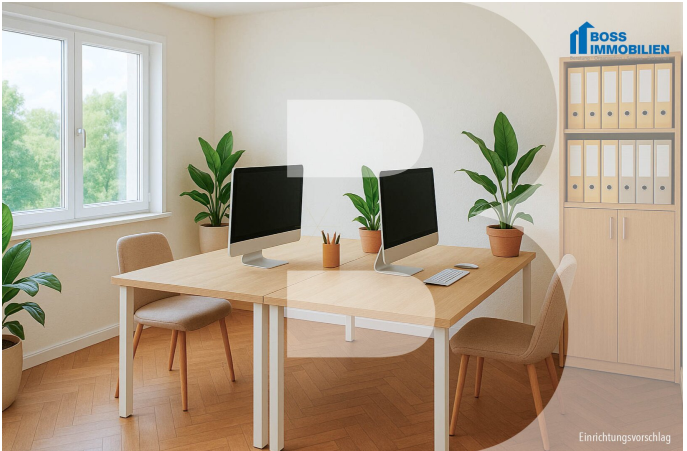
01 Titelbild Büro