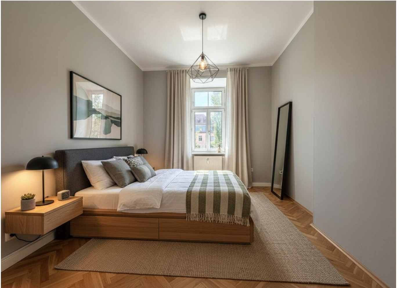
Schlafzimmer - mögliche Einrichtung