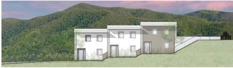
REIHENHAUS, TOP A