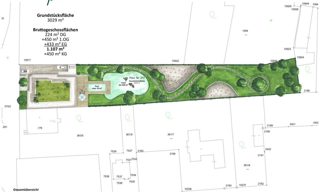
Gesamtübersicht Projektstudie Maria Enzersdorf Schulplatz 1 2344 Maria Enzersdorf

Bruttogeschossflächen 224 m 2 DG +450 m 2 1.OG +433 m 2 EG 1.107 m 2 +450 m 2 KG