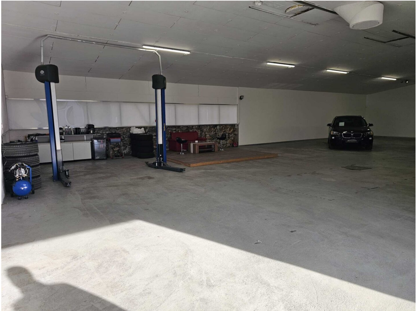
Halle zur Miete

310 m 2 Lagerhalle, Verkaufshalle, Halle für Autohandel, Fahrzeugaufbereitung, Lackierung, Gewerbehalle, etc. zu vermieten - provisionsfrei!