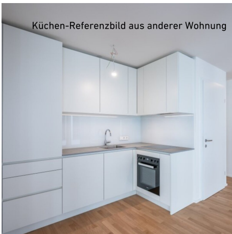
Küchen-Referenzbild aus anderer Wohnung