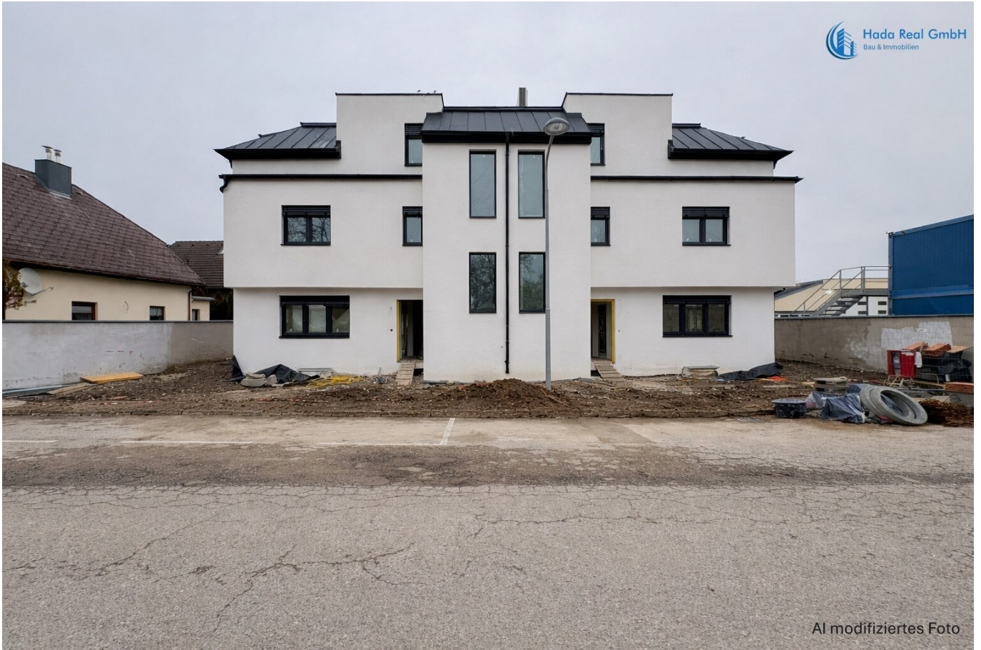
AI modifiziertes Foto