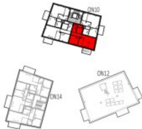
Übersicht 3. Obergeschoss M=1 : 1250