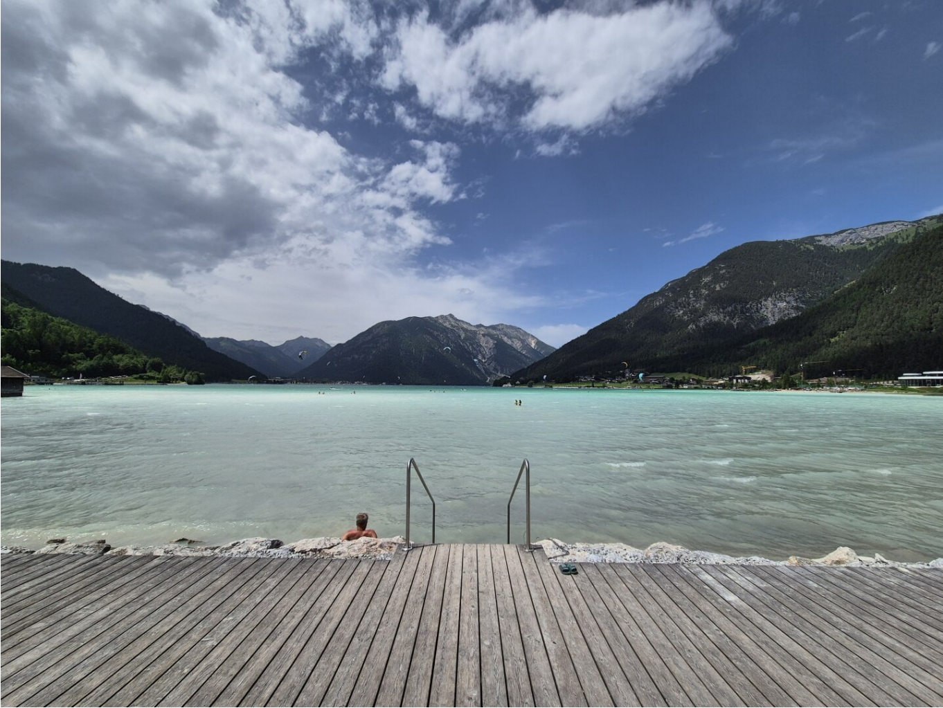
* SEENÄHE *