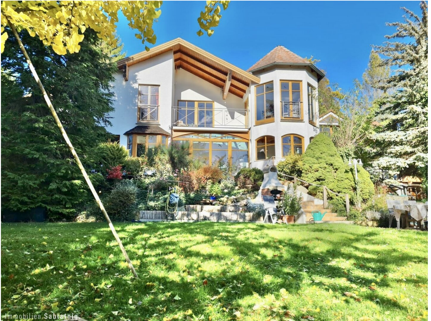
Einzigartige Villa in Pressbaum

!!!VERMITTELT!!! EXQUISITE VILLA AM WALDRAND!