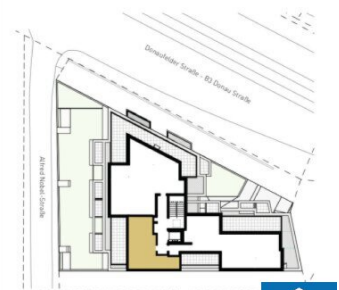
ORIENTIERUNGSPLAN | +4 DACHGESCHOSS

2025.03.11 | D02 WOHNUNGSPLAN | DS104_A00_PP_X