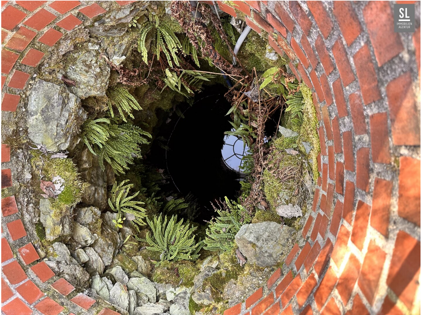
Brunnen vor der Haustür