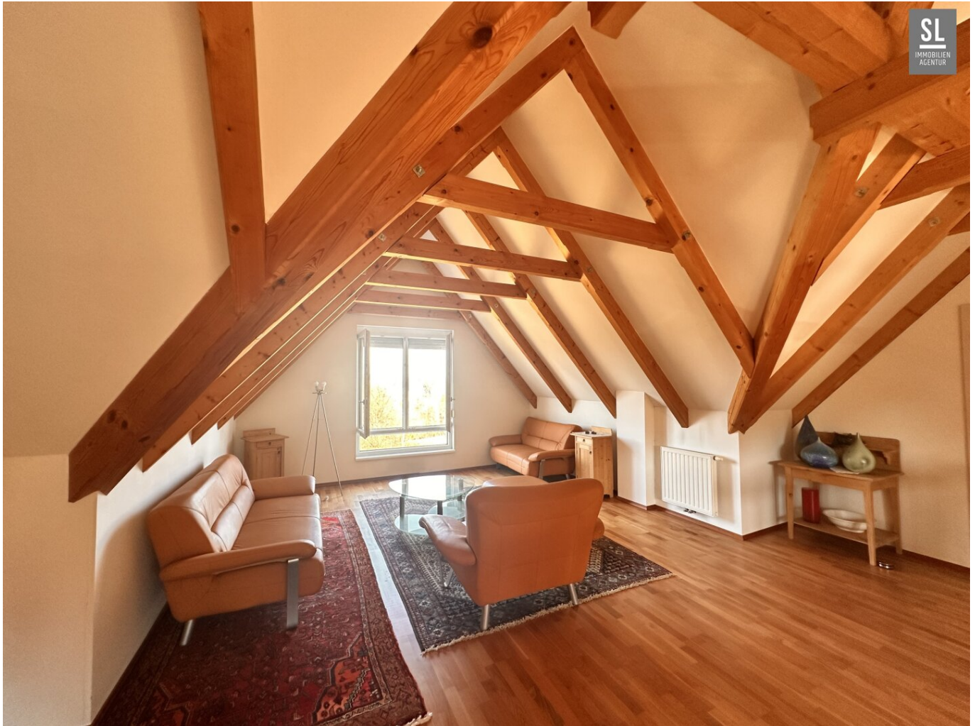
Gemütlichkeit im Obergeschoss