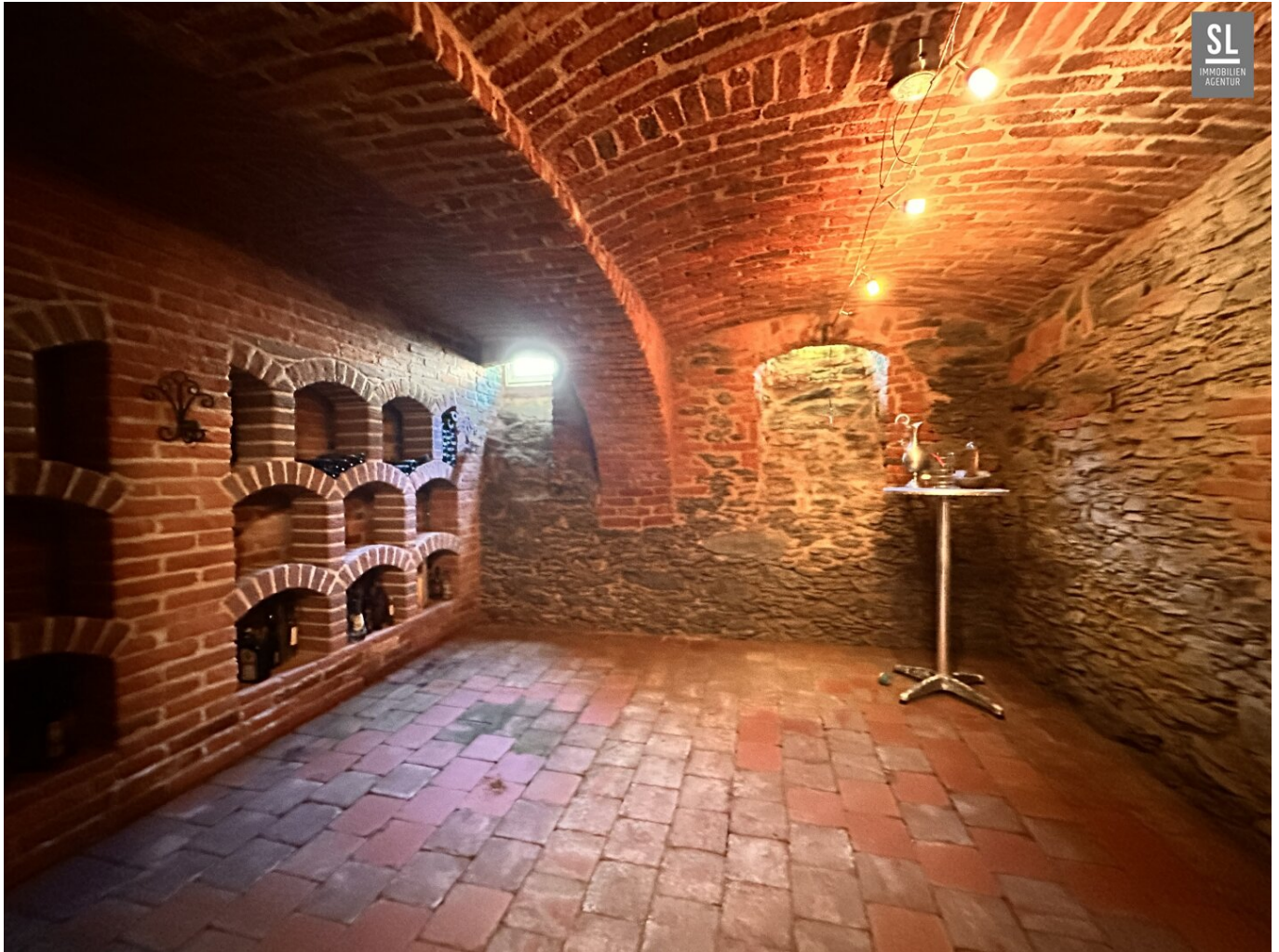
Weinkeller Foto 1