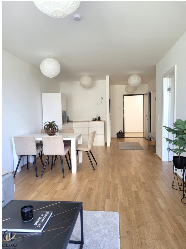
Helles WZ mit offener KÜ