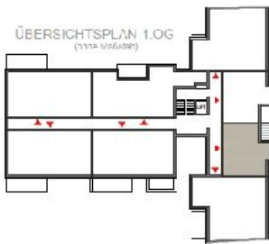
ÜBERSICHTSPLAN 1.OG (1:100 Maßstab)