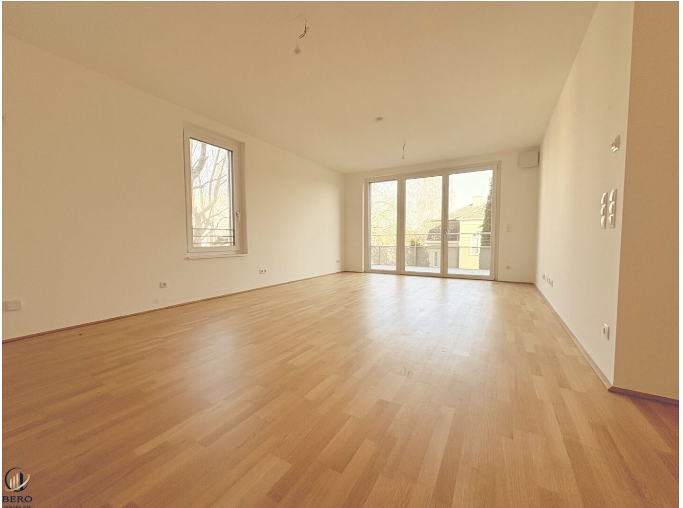
Wohnküche Richtung Balkon