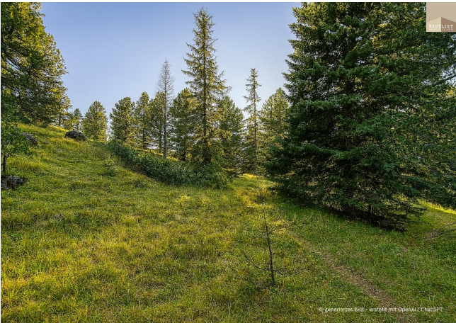
KI-generiertes Bild - erstellt mit OpenAI / ChatGPT