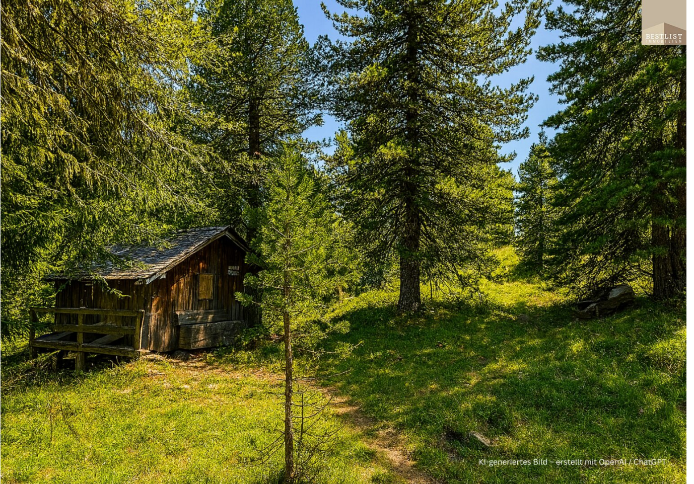
KI-generiertes Bild - erstellt mit OpenAI / ChatGPT