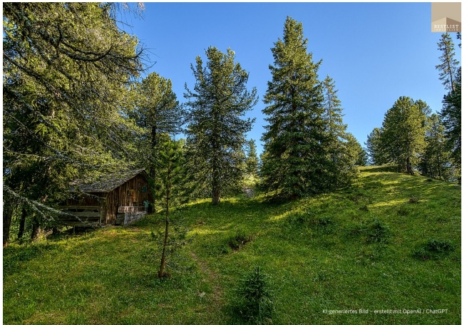
KI-generiertes Bild - erstellt mit OpenAI / ChatGPT