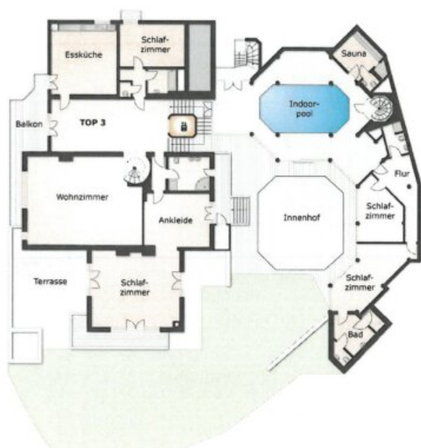
Grundriss Top 3 1. Obergeschoss