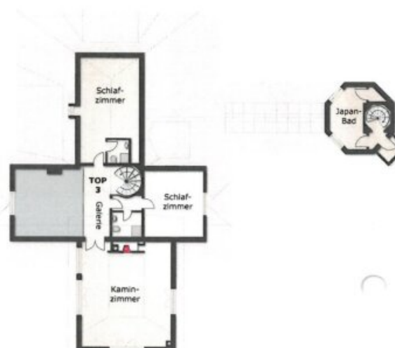
Grundriss Top 3 2. Obergeschoss