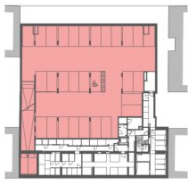
ohne Maßstab ÜBERSICHT: KELLERGESCHOSS

Die Einrichtung ist illustrativ dargestellt; zur tatsächlichen Ausstattung siehe aktuelle Bau- und Ausstattungsbeschreibung; vorbehaltlich technisch notwendiger Änderungen!