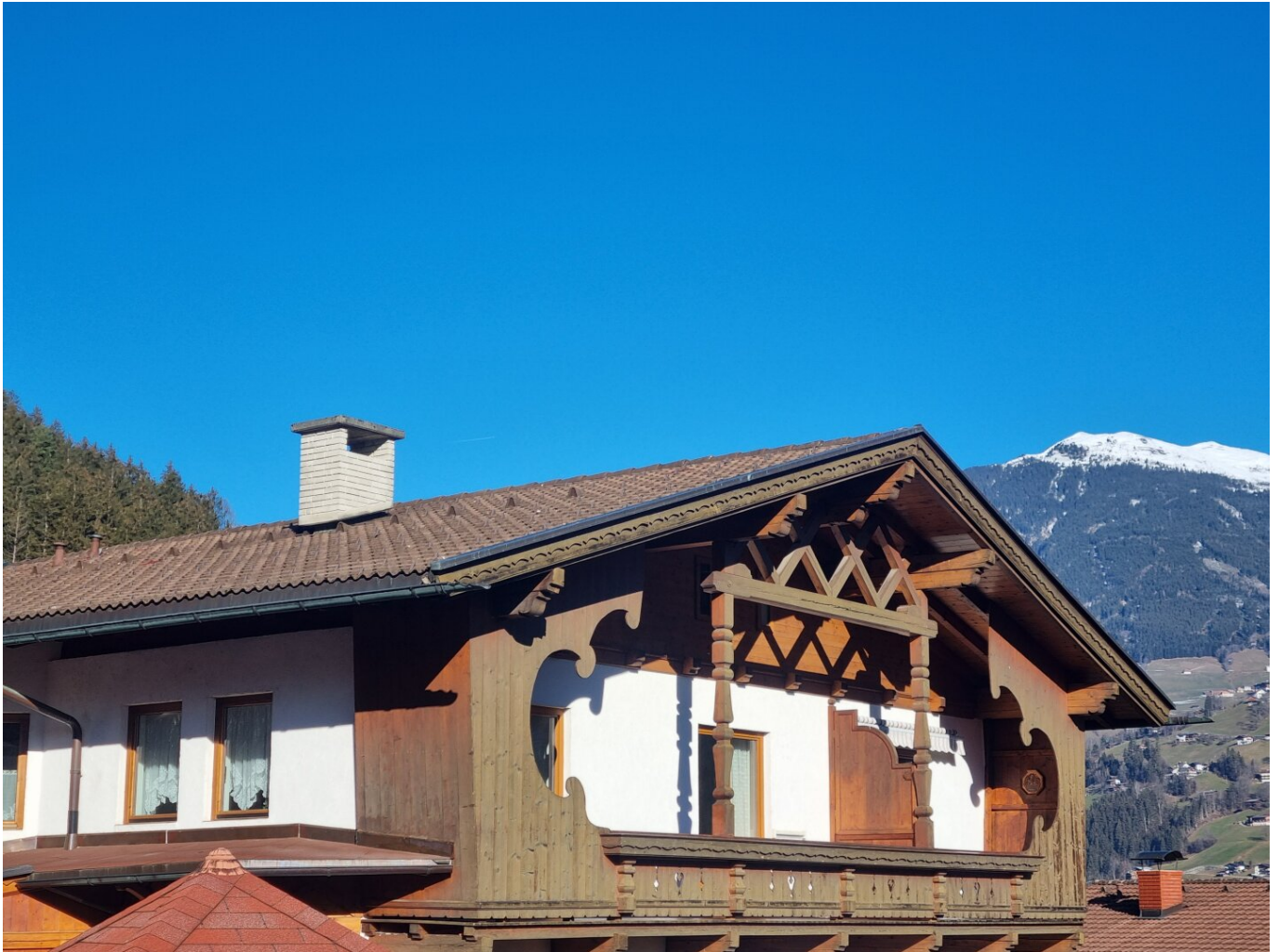
Außenansicht Wohnung 1 Stock