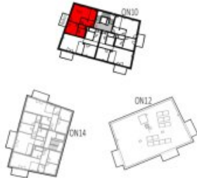
Übersicht 3. Obergeschoss M=1 : 1250