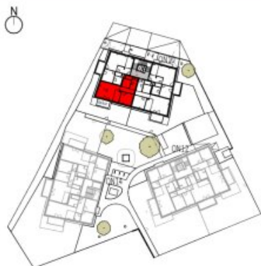
Übersicht 1. Obergeschoss M=1 : 1250