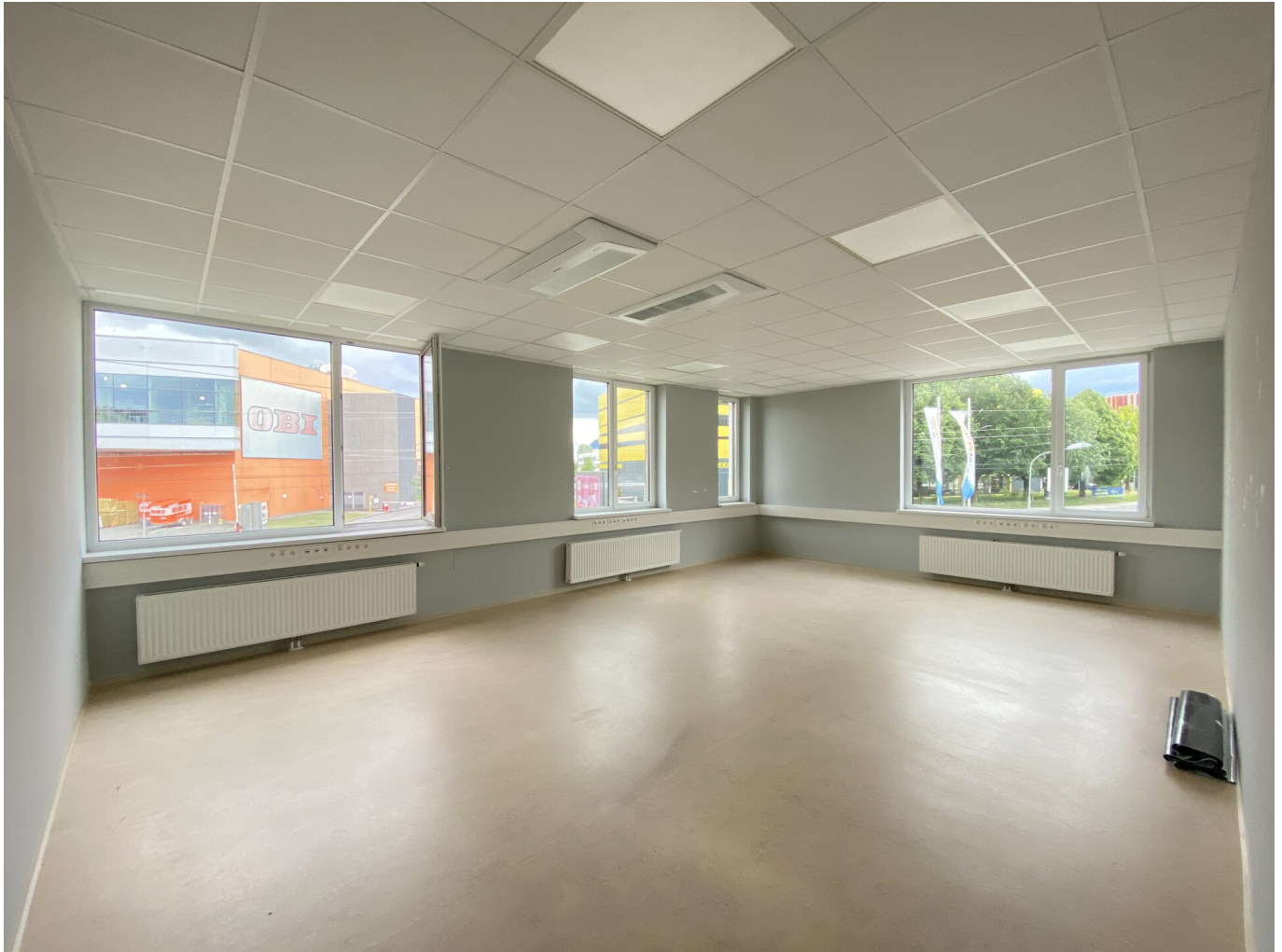
Raum 4 (3)