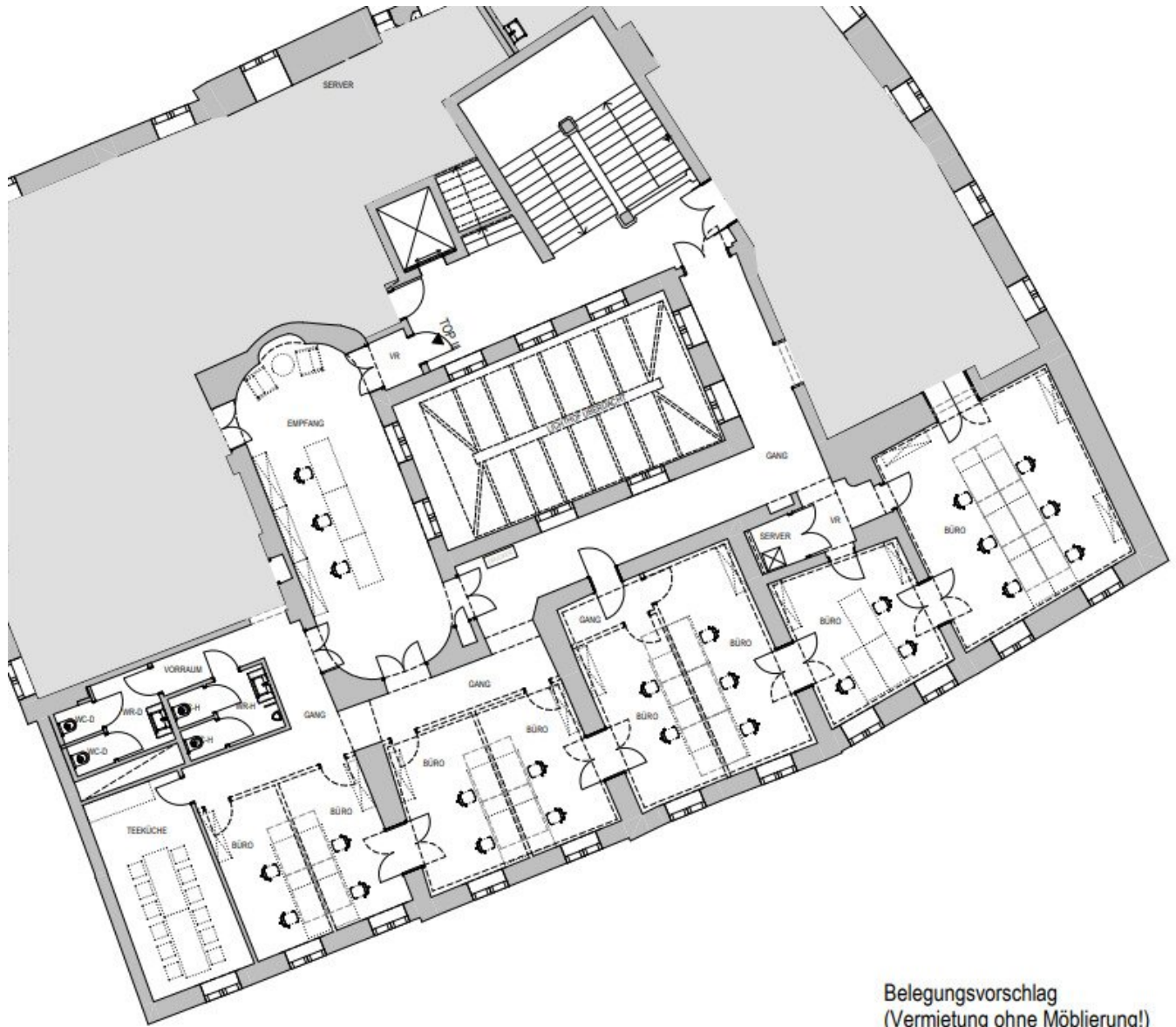
Belegungsvorschlag (Vermietung ohne Möblierung!)