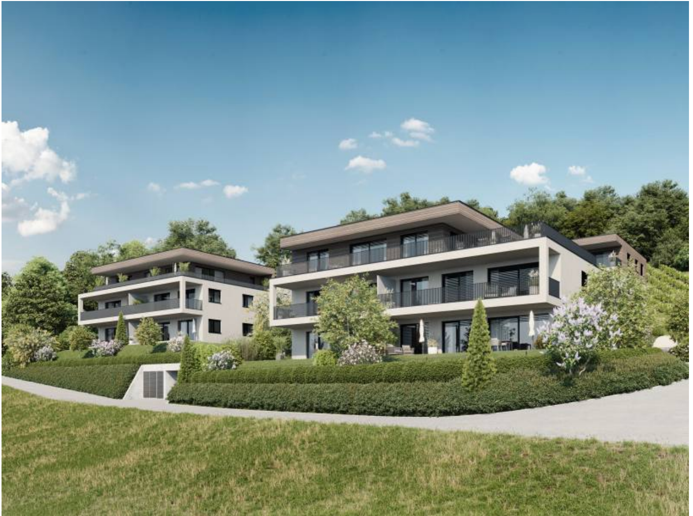
Haus B + A