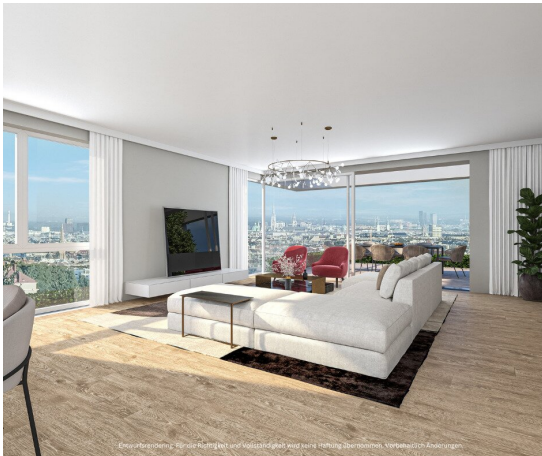
Entwurfsrendering. Für die Richtigkeit und Vollständigkeit wird keine Haftung übernommen. Vorbehaltlich Änderungen.