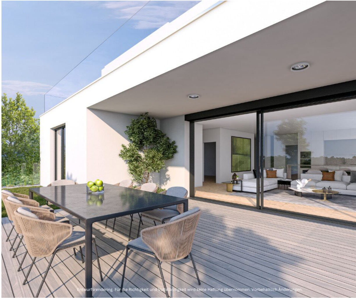
Entwurfsrendering. Für die Richtigkeit und Vollständigkeit wird keine Haftung übernommen. Vorbehaltlich Änderungen.