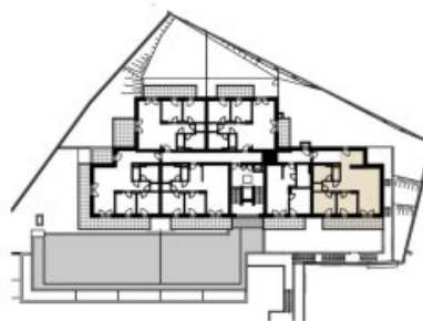
GRUNDRISS BK 04

Unverbindliche Grundrissinformation. Für gelieferte Qualitäten ist ausschließlich die Bau- und Ausstattungsbeschreibung verbindlich. Die dargestellte Möblierung - ausgenommen Waschtische, Dusche, Badewanne, WC - ist nicht Bestandteil des Lieferumfanges und dient nur als Einrichtungsvorschlag. Alle Quadratmeter sind nach Rohbaumaßen berechnet und berücksichtigen keine Wandbeläge wie z.B. Verputz und Fliesen. Änderungen in der Ausführung vorbehalten! Toleranzen bis zu 3% der Gesamtfläche sind möglich. Etwasige Bodenabläufe und Putzschächte im Außenbereich, sowie haustechnische Leitungsführungen im Innenbereich sind in den Plänen nicht dargestellt und werden nach Erfordernis hergestellt.