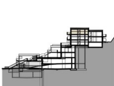
SCHNITT BK 02+04