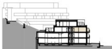
SCHNITT BK 01