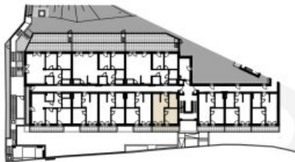
GRUNDRISS BK 01