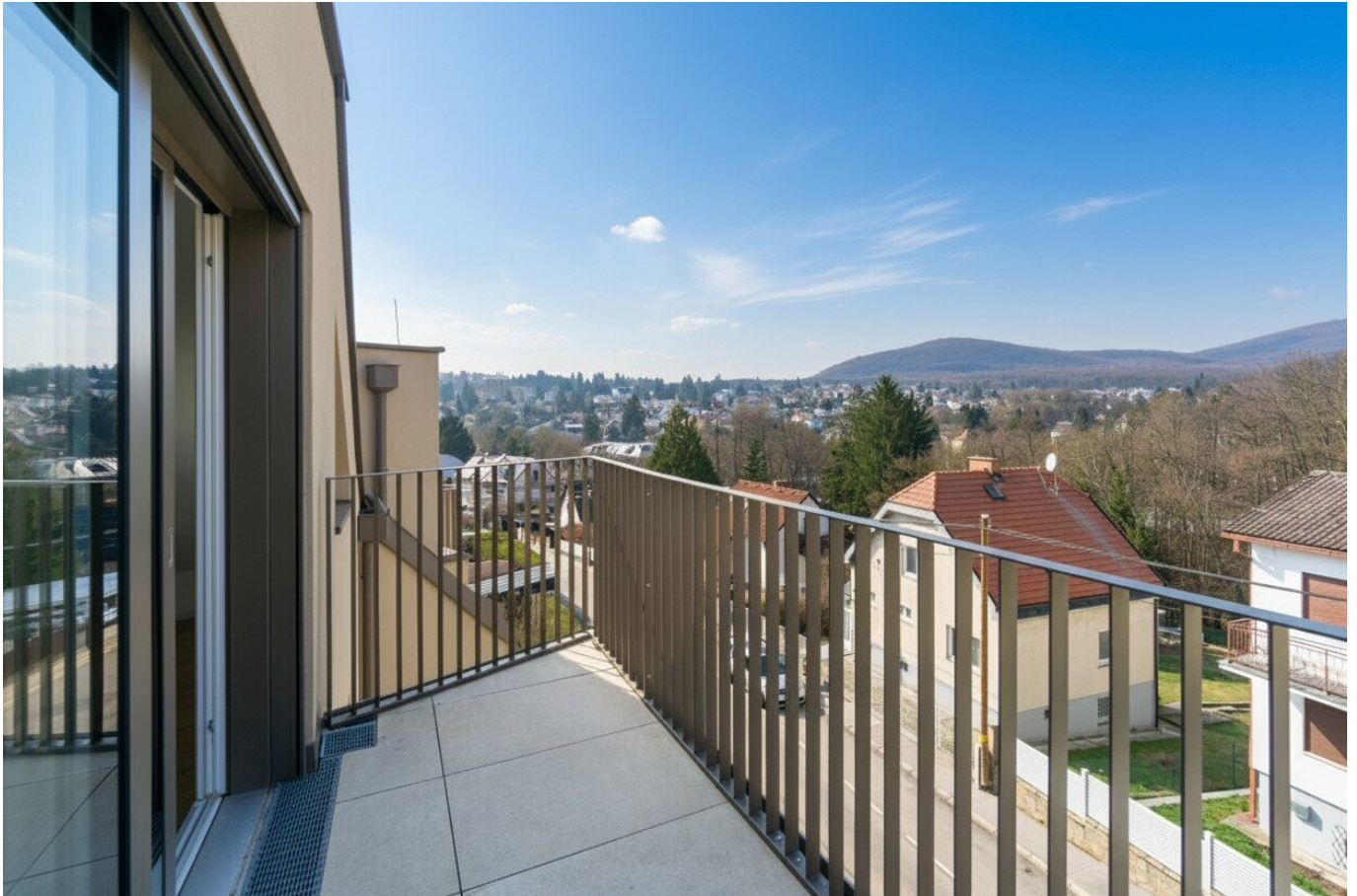
Ausblick Zimmer 3