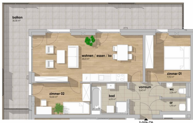
grundriss M 1:75