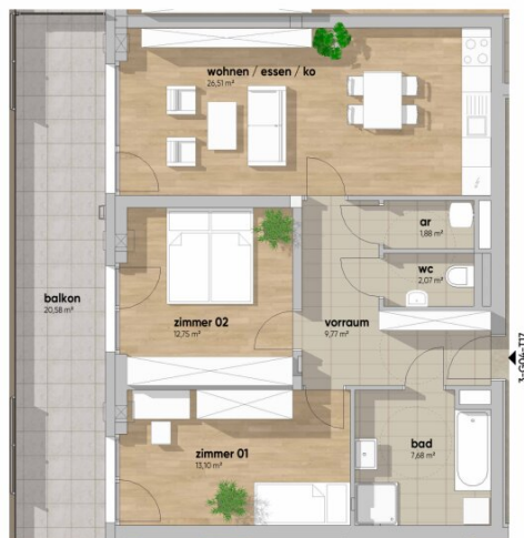
grundriss M 1:75