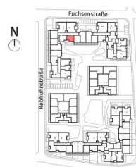
Lageplan ohne Maßstab