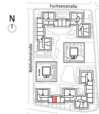
Lageplan ohne Maßstab