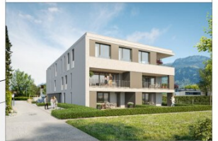
enderstraße 26, altach