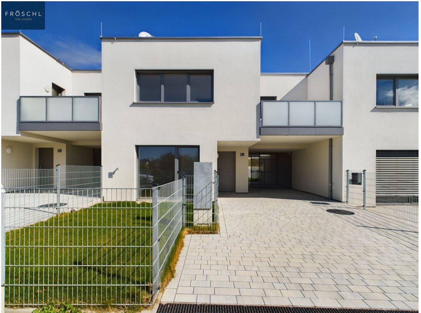
Reihenhaus 6 Straßenansicht 1