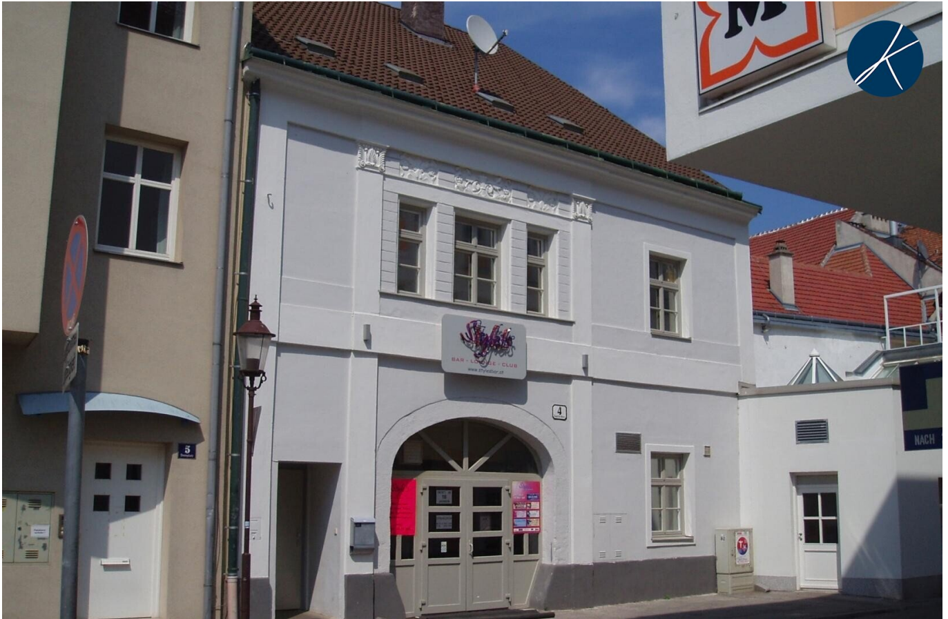
Ansicht vom Domplatz