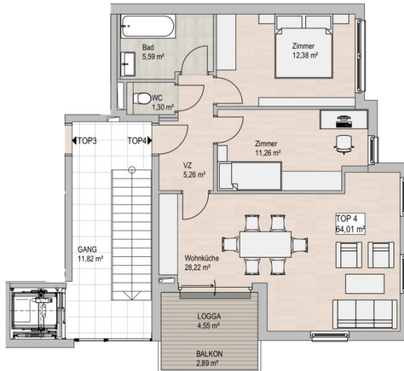
GRUNDRISS 1.OBERGESCHOSS 1/100

Allgemeines Geringfügige Änderungen bleiben vorbehalten. Die dargestellten Möblierungen sind im Kaufpreis nicht inbegriffen