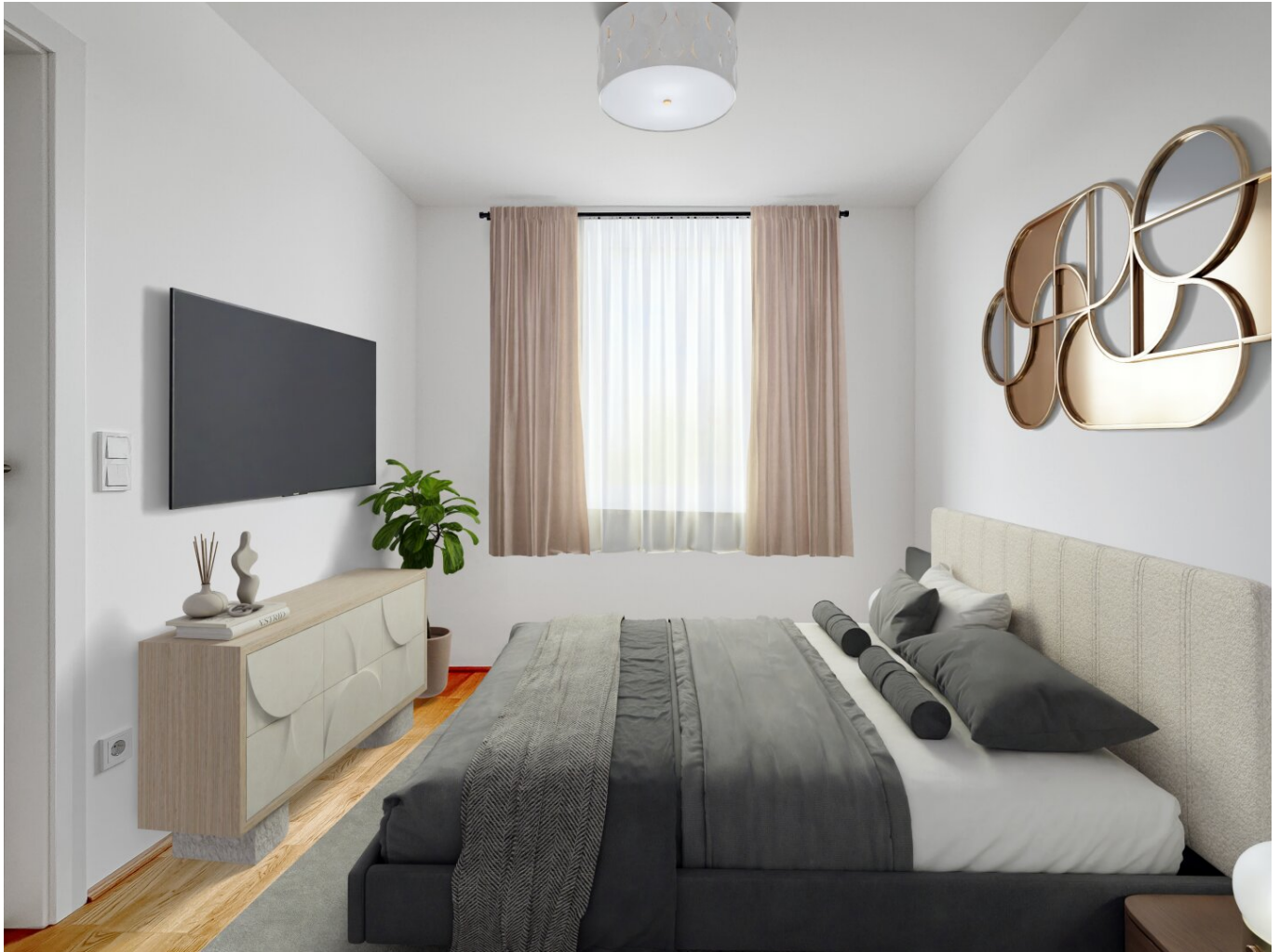
Schlafzimmer - Digital Staging